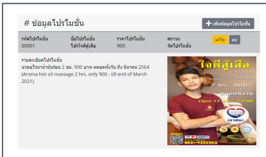
ภาพที่ ก.19 หน้าจัดการข้อมูลโปรโมชั่น

หน้าจัดการข้อมูลโปรโมชั่น สามารถเพิ่ม, ลบ, แก้ไขได้