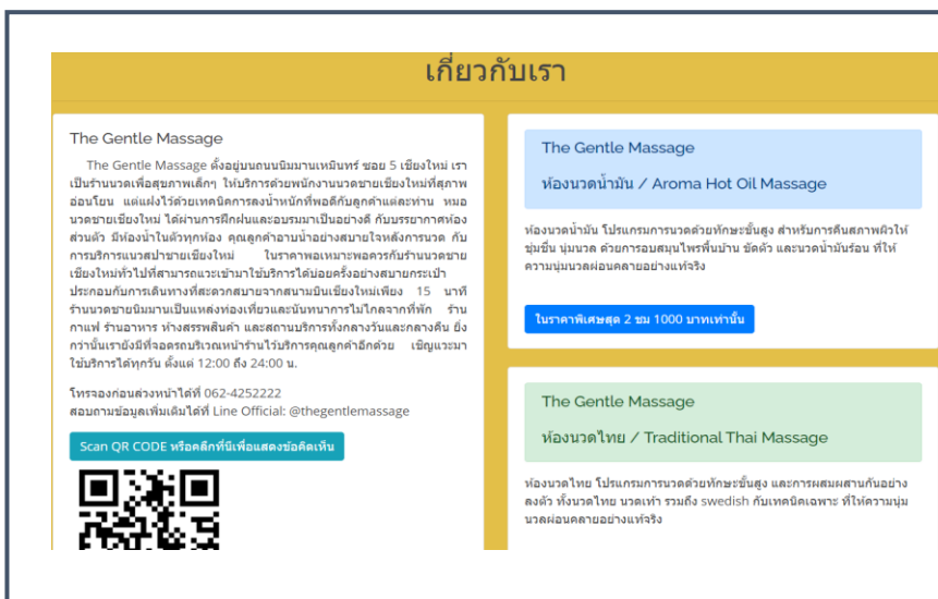
ภาพที่ ก.2 หน้าเกี่ยวกับเรา

หน้าเกี่ยวกับเราแสดงรายละเอียดเกี่ยวกับการให้บริการของร้าน ราคาในการให้บริการ