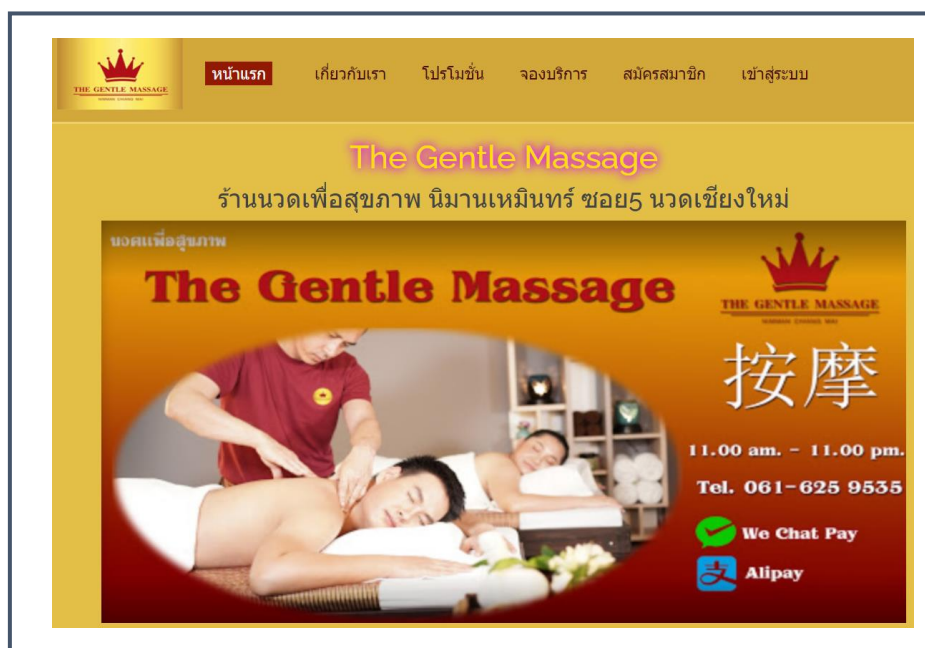
ภาพที่ ก.1 หน้าแรกของเว็บไซต์

หน้าแรกแสดงข้อมูลพื้นฐานเกี่ยวกับร้านมีแถบเมนูอยู่ด้านบนคอยนำทางไปส่วนต่าง ๆ