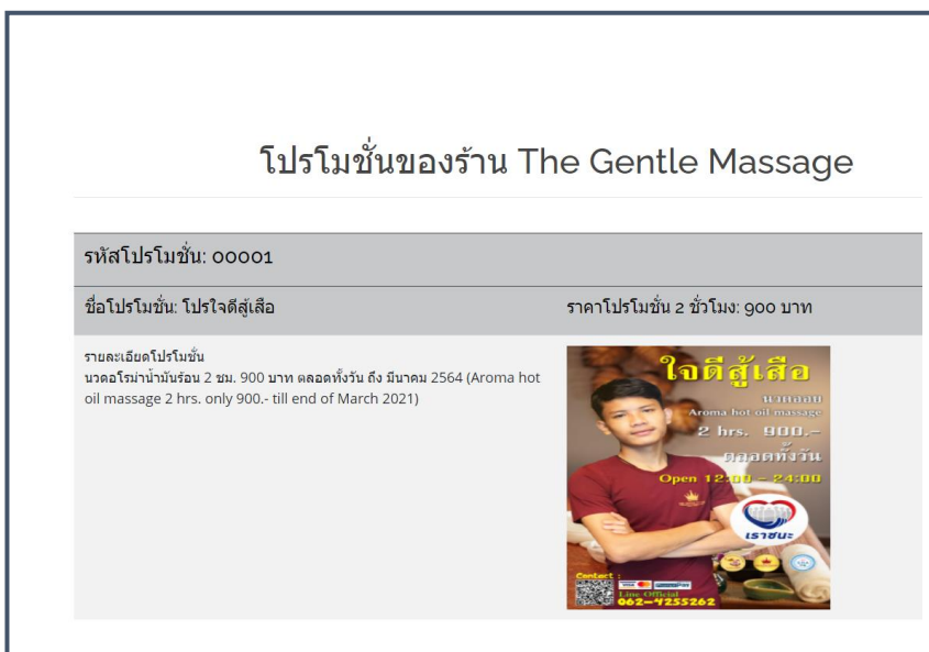
ภาพที่ ก.3 โปรโมชั่นที่จัดอยู่

หน้าเกี่ยวกับเราแสดงรายละเอียดเกี่ยวกับการให้บริการของร้าน ราคาในการให้บริการ